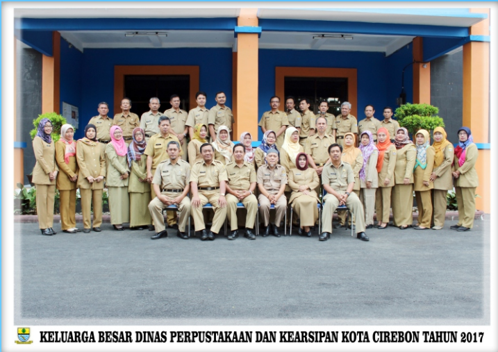
KELUARGA BESAR DINAS PERPUSTAKAAN DAN KEARSIPAN KOTA CIREBON TAHUN 2017

Jl. Brigjen Dharsono (By-pass) No. 11 Telp. (0231) 486605/ Fax (0231) 486992 Cirebon