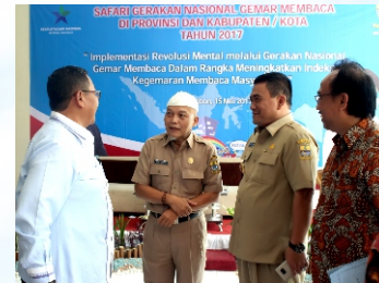
Safari Gerakan Nasional Gemar Membaca