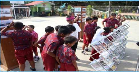
Go To school arsip Penyuluhan Arsip ke Satuan Pendidikan Di SDN BIMA Kota Cirebon