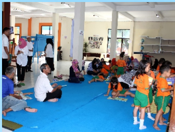
Kunjungan TK Pertiwi Cirebon