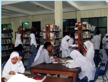
Layanan Baca di Tempat