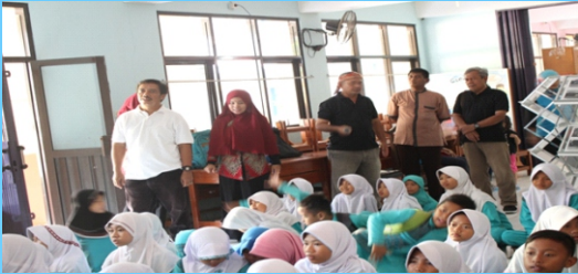
Go To school Arsip Penyuluhan Arsip ke Satuan Pendidikan Pemutaran film sejarah Cirebon Di SDN karang Yudha Kota Cirebon