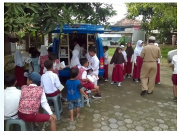
Layanan Perpustakaan Keliling