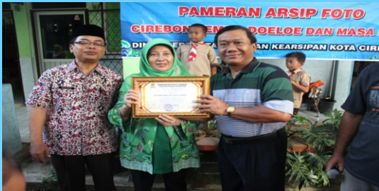
Go To school arsip Penyuluhan Arsip ke Satuan Pendidikan Melihat Foto sejarah-sejarah Cirebon Di SDN karang Yudha Kota Cirebon